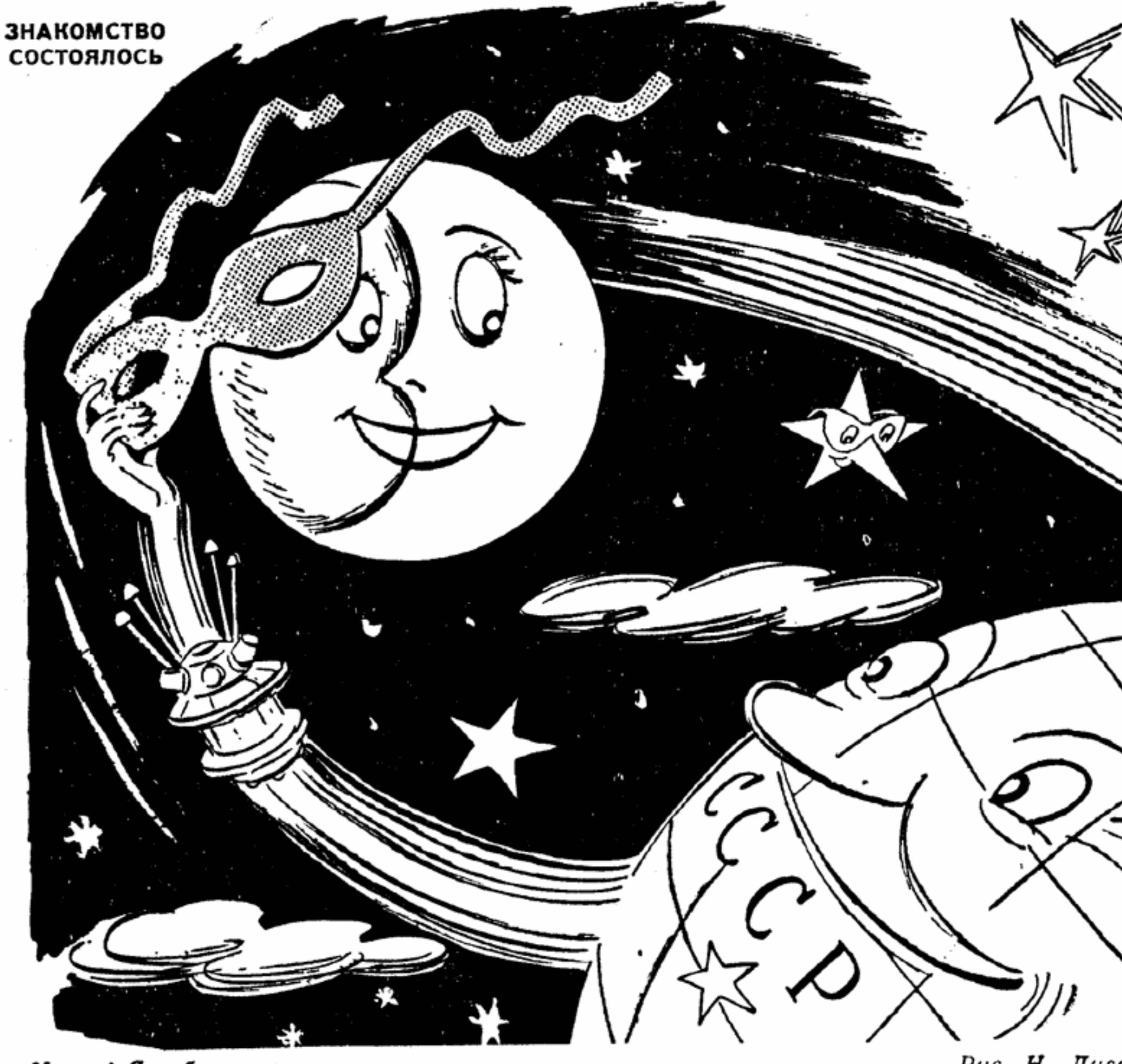
Маска! Я тебя знаю. Рис. Н. Лисогорского

Знакомство состоялось Маска! Я тебя знаю. Рис. Н. Лисогорского